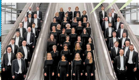
MDR Rundfunkchor Leipzig